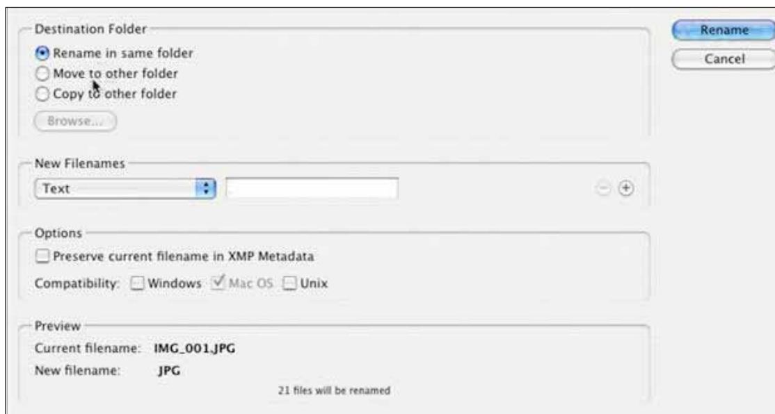
Figura 1: A caixa de diálogo Batch Rename permite renomear uma quantidade de imagens de uma vez só.