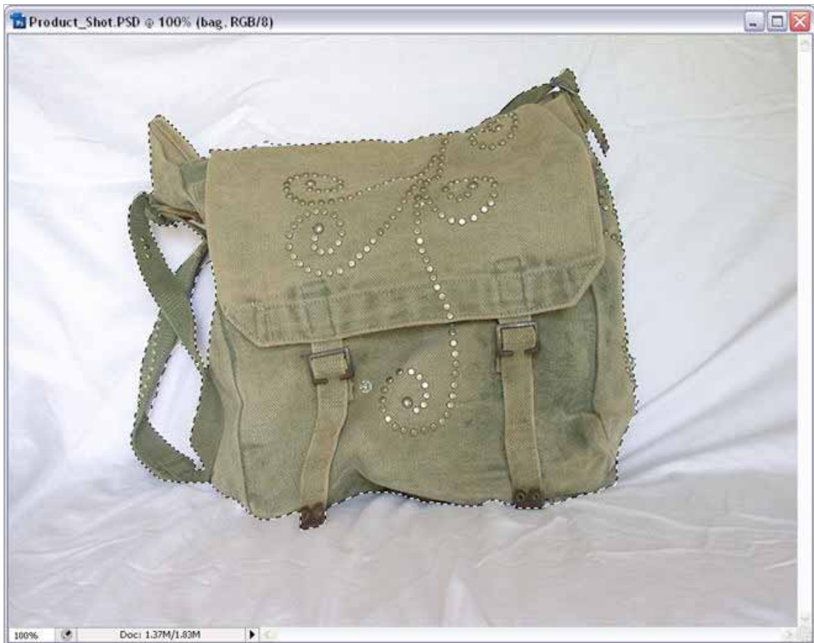
Figura 2: Exclua as áreas brancas entre as alças da mala.