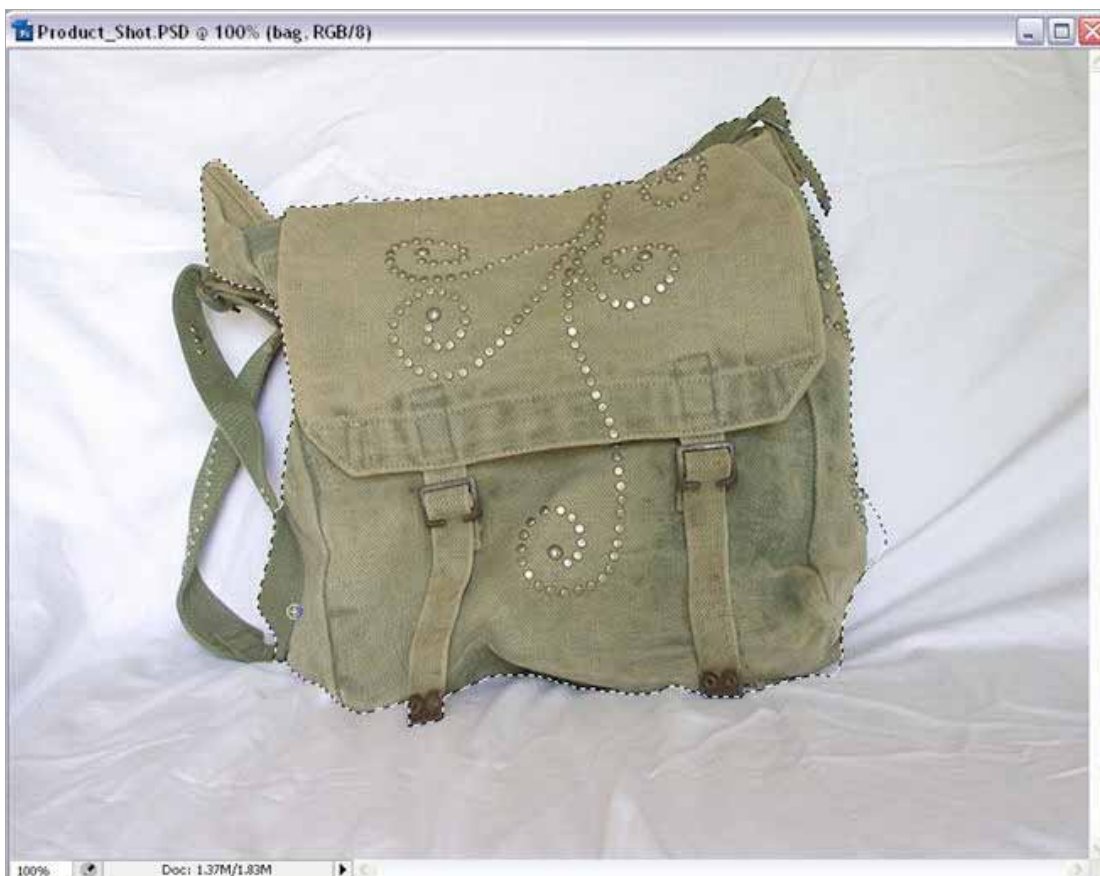
Figura 1: Selecciona a mala com a ferramenta Quick Selection (selecção rápida).