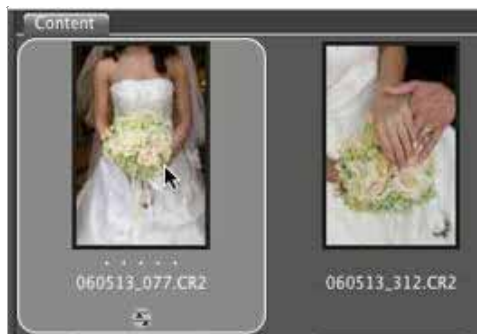
Figura 3: Quando uma imagem é modificada em Camera Raw, aparece um ícone por baixo da miniatura, na Bridge.