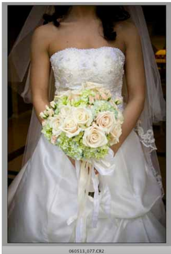
Figura 1: Aumentar o valor de Lens Vignetting acrescenta uma sombra à parte exterior da imagem.