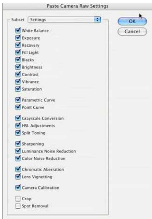
Figura 4: A caixa de diálogo Paste Camera Raw Settings permite aplicar alguns ou todos os ajustes.

Pode usar apenas algumas definições Camera Raw da imagem original escolhendo-as da caixa aberta; ou escolher definições individuais utilizando as caixas activadoras; ou, ainda, simplesmente fazer clique em OK para aceitar todas as definições. Clique OK para aceitar todas as definições.