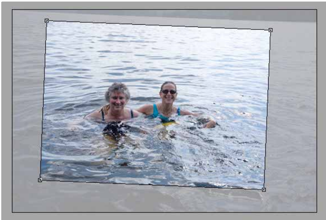
Figura 3: Corte a imagem e rode-a para que fique direita.

Agora a imagem está direita quando a passar para o Photoshop CS3 para outras correcções.