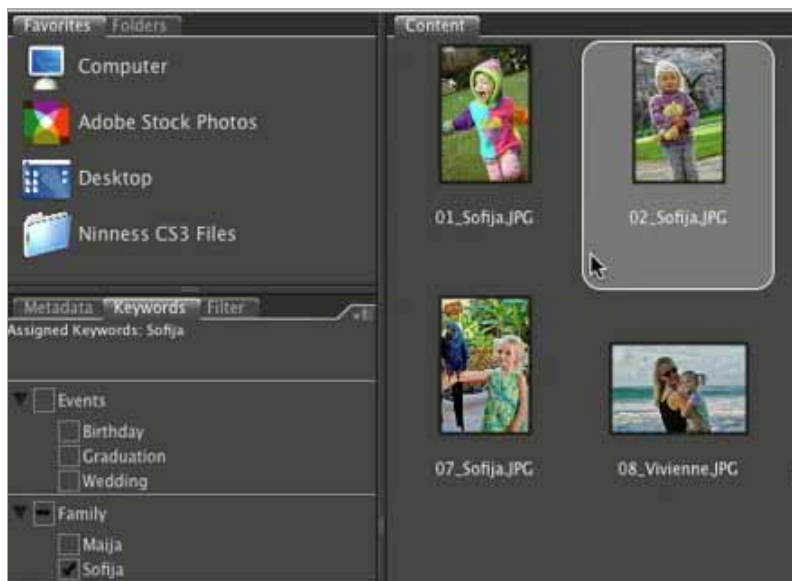
Figura 2: Pode atribuir palavras-chave a imagens individuais ou conjuntos de imagens.